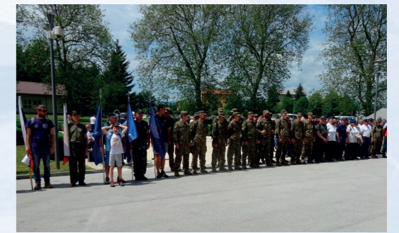
Pohod v spomin na pekrške dogodke, 21. 5. 2022