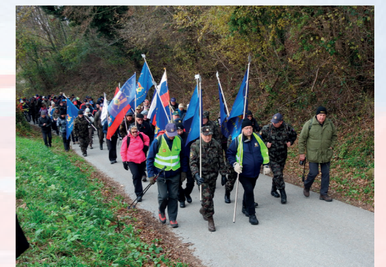
Pohod po poteh soške fronte, 1. 12. 2018