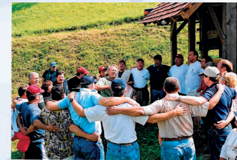
Harmonika in pesem s prijatelji, Maribor 14. 9. 2002