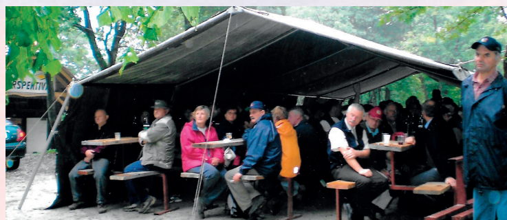
Srečanje prijateljskih organizacij, Krašnji vrh, 16. 9. 2006