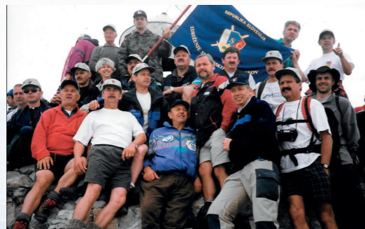
15. pohod na Triglav, 15. 7. 2000