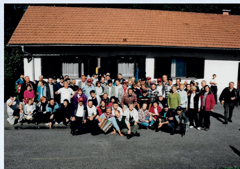
Pohod pri OZSČ Maribor, 4. 10. 2003