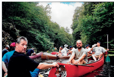
Spust po reki Lahinji, 14. 8. 2004