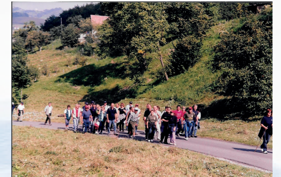
Pohod Mariborčanov in Novomeščanov, 14. 9. 2002