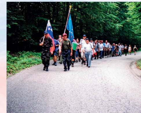
Pohod na Trebelno, 7. 9. 2002