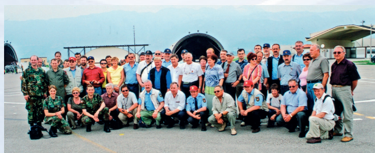
Obisk v letalski bazi Aviano, v Italiji, 3. 5. 2006