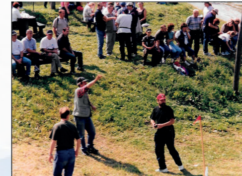
Tekmovanje v metanju bombe na cilj, Maribor 14. 9. 2002