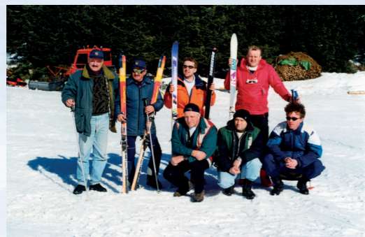
Smučarsko tekmovanje Golte, 5. 2. 2000