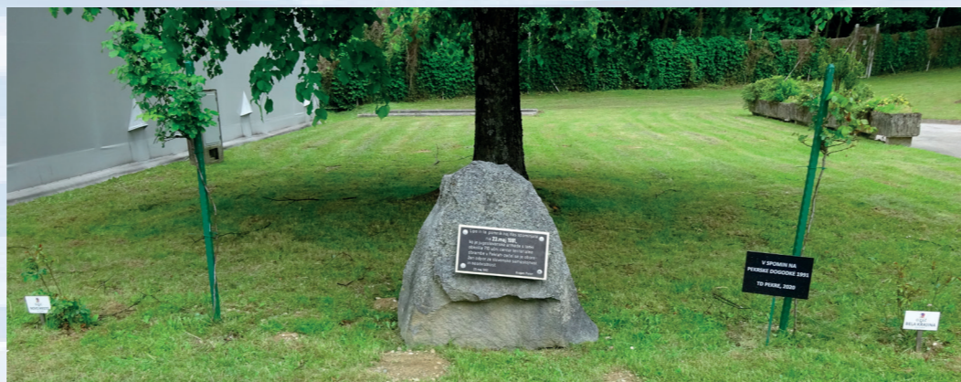
Spominska plošča v Pekrah z vrtnicami ZSČ, ZVVS, OZSČ Bela krajina in Novo mesto, 21. maj 2022

S srečanjem takratnih in sedanjih predsedstev v OZSČ Maribor, Metlika oz. Bela krajina, Nova Gorica, ZSČ Brežice in OZSČ Novo mesto, Dolenjske Toplice, Mirna Peč, Šentjernej, Škocjan, Šmarješke Toplice, Staža in Žužemberk se spominjamo teh časov, predvsem pa da se sodelovanje nadaljuje tudi vnaprej.