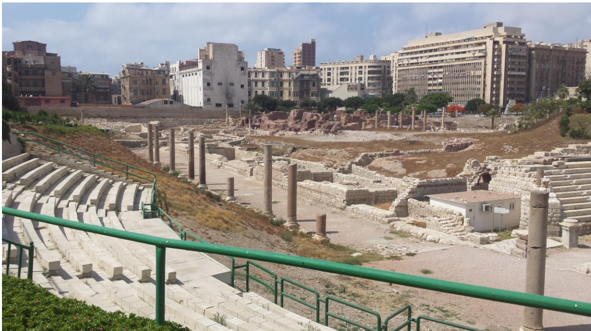
Rimske izkopanine v Aleksandriji