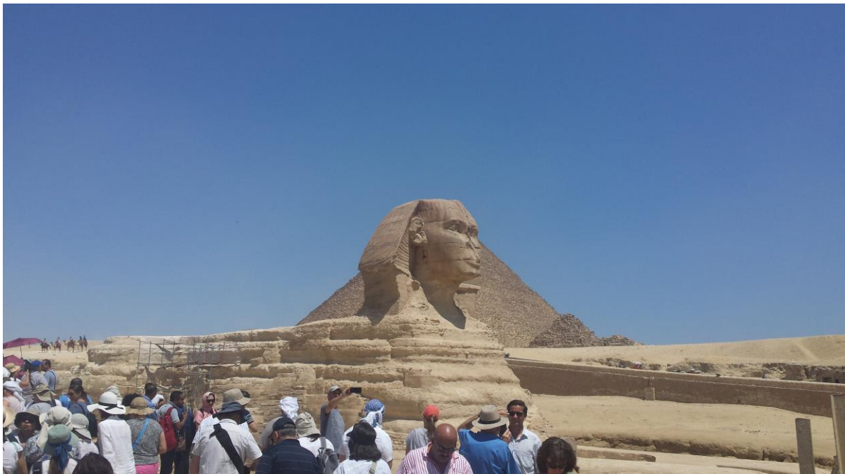
Skupinska fotografija pred sfingo s Keopsovo piramido v ozadju

Projekt, ki se zanaša (tudi) na 3,1 milijona evrov evropske pomoči in podporo konzorcija petih evropskih muzejev (med njimi sta British Museum in Louvre), predvideva dolgotrajno vizijo in napredek, ki bodo muzeju – tako vsaj upa Egipt – zagotovili tudi mesto na Unescovem seznamu kulturne dediščine.