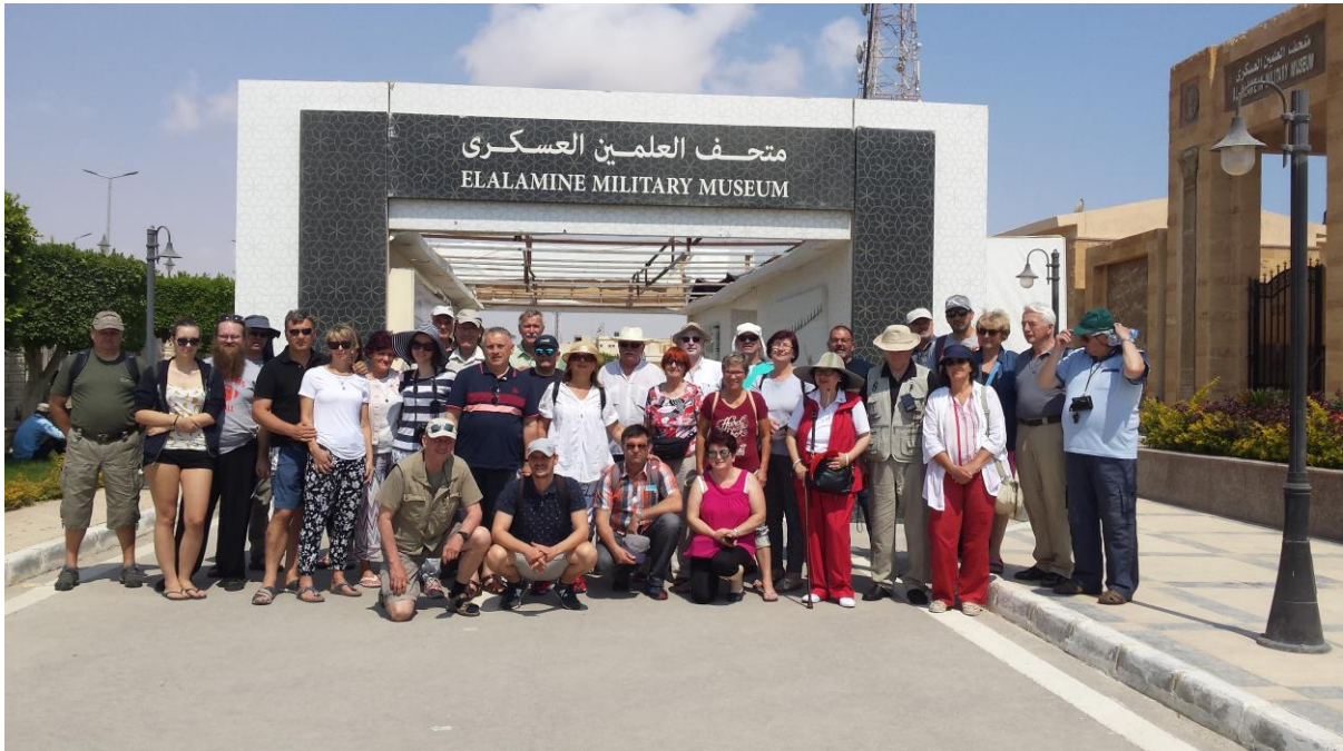
Pred vhodom v muzej El Alamein