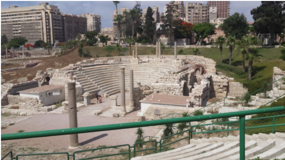
Ohranjeni del rimskega teatra v Aleksandriji