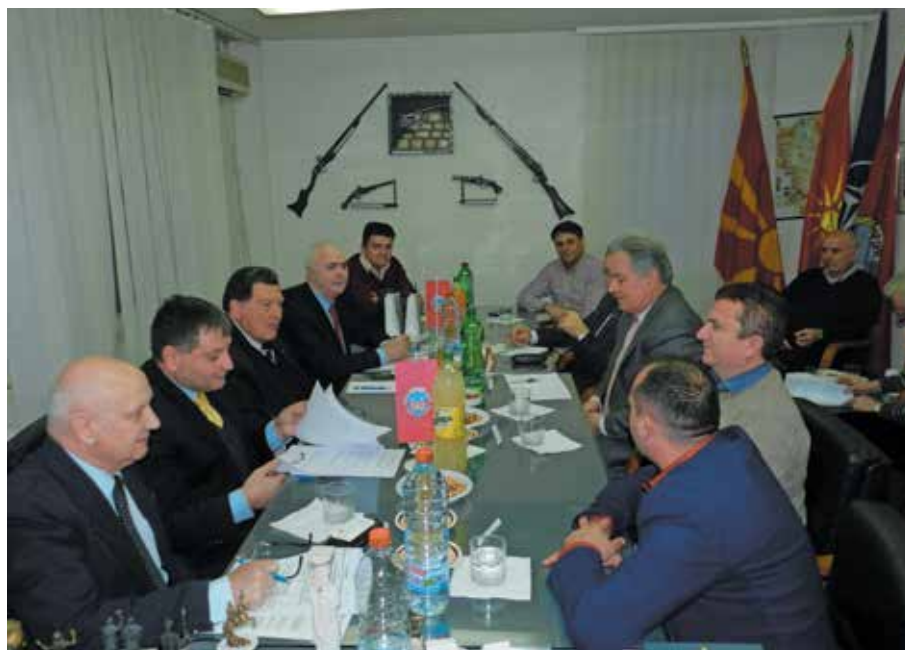
Delovno srečanje z ORORM

do tega vprašanja v preteklih dveh desetletjih. Za primerjavo dodajmo, da sta Slovenija in Makedonija istočasno začeli uveljavljanje akcijskih načrtov za članstvo v Natu. V makedonskih obrambnih in vojaških strukturah v letu 2018 uresničujejo že 18. letni načrt za članstvo v Natu. To obdobje in dejstvo se je odrazilo na poteku obrambno-vojaških reform, financiranju obrambnih potreb in posledično tudi na pripravljenosti teh struktur in njihovem prepričanju, da se bo premik vendarle zgodil.