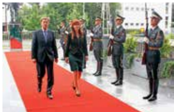
POMEMBNI ZA MEDNARODNO SKUPNOST IN UGLED SLOVENIJE