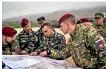
SLOVENIJA V KFORJU