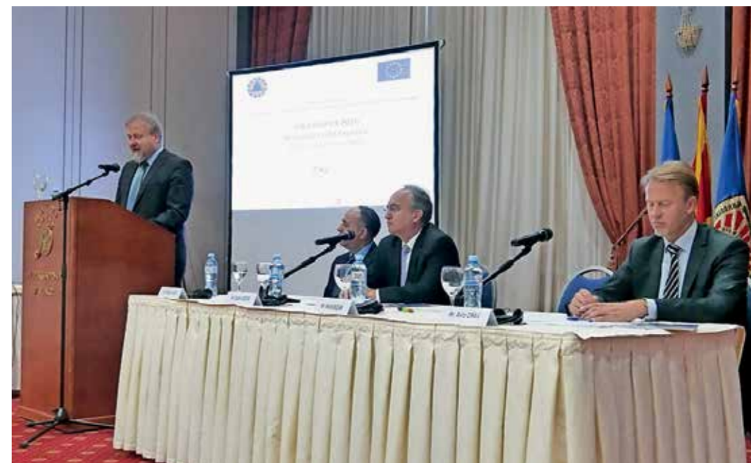
DRŽAVNI SEKRETAR MO MILOŠ BIZJAK NAGOVARJA MEDNARODNE OPAZOVALCE NA PREDSTAVITVENI KONFERENCI.