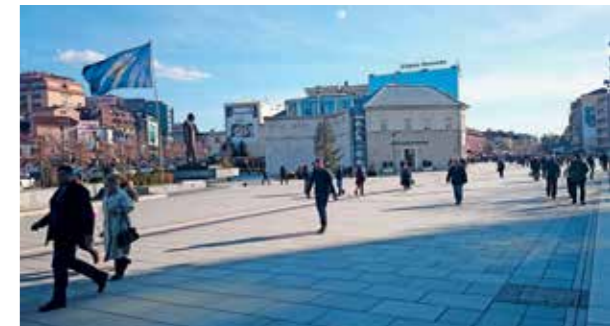
GLAVNA SPREHAJALNA ULICA V PRIŠTINI - BULEVARDI NENE TEREZA