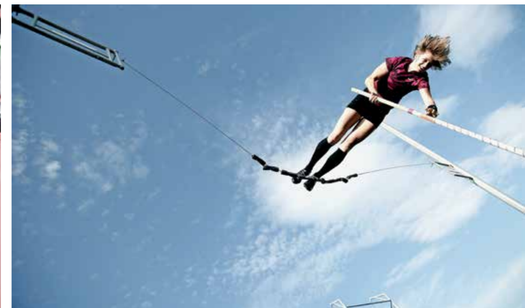
VISOKO NAD TLEMI