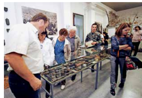
NEKATERI VOJAKI SO SI PO SLOVESNOSTI V SPREMLJANJU STARŠEV, SVOJCEV IN PRIJATELJEV OGLEDALE TUDI VOJNI MUZEJ VIPAVA.

člani ter sorodniki so se ob koncu vojaške slovesnosti zadržali na prijateljskem druženju, vsi ljubitelji vojaške zgodovine pa so se lahko odpravili na voden ogled po Vojnem muzeju Vipava, v katerem so si ogledali bogato zbirko muzejskih razstavnih predmetov in izkopenan iz obdobja soške fronte. ■