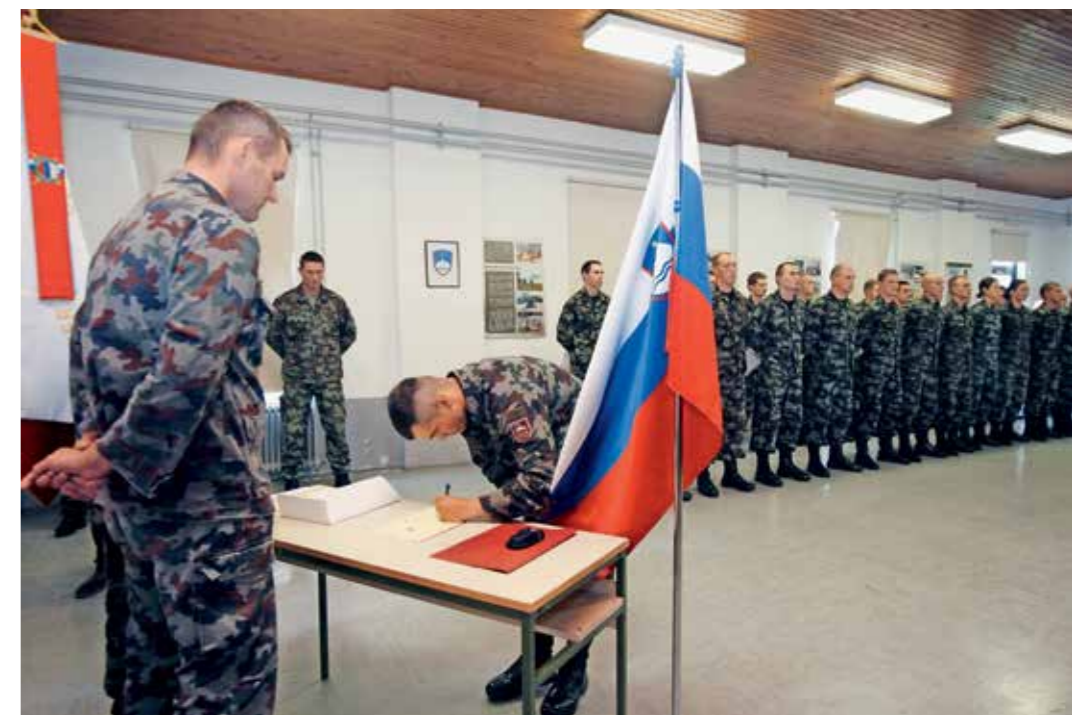
S PODPISOM PRISEGE SO KANDIDATI ZA VOJAKE IN PROSTOVOJLJCI IZRAZILI ZVESTOBO DOMOVINI.