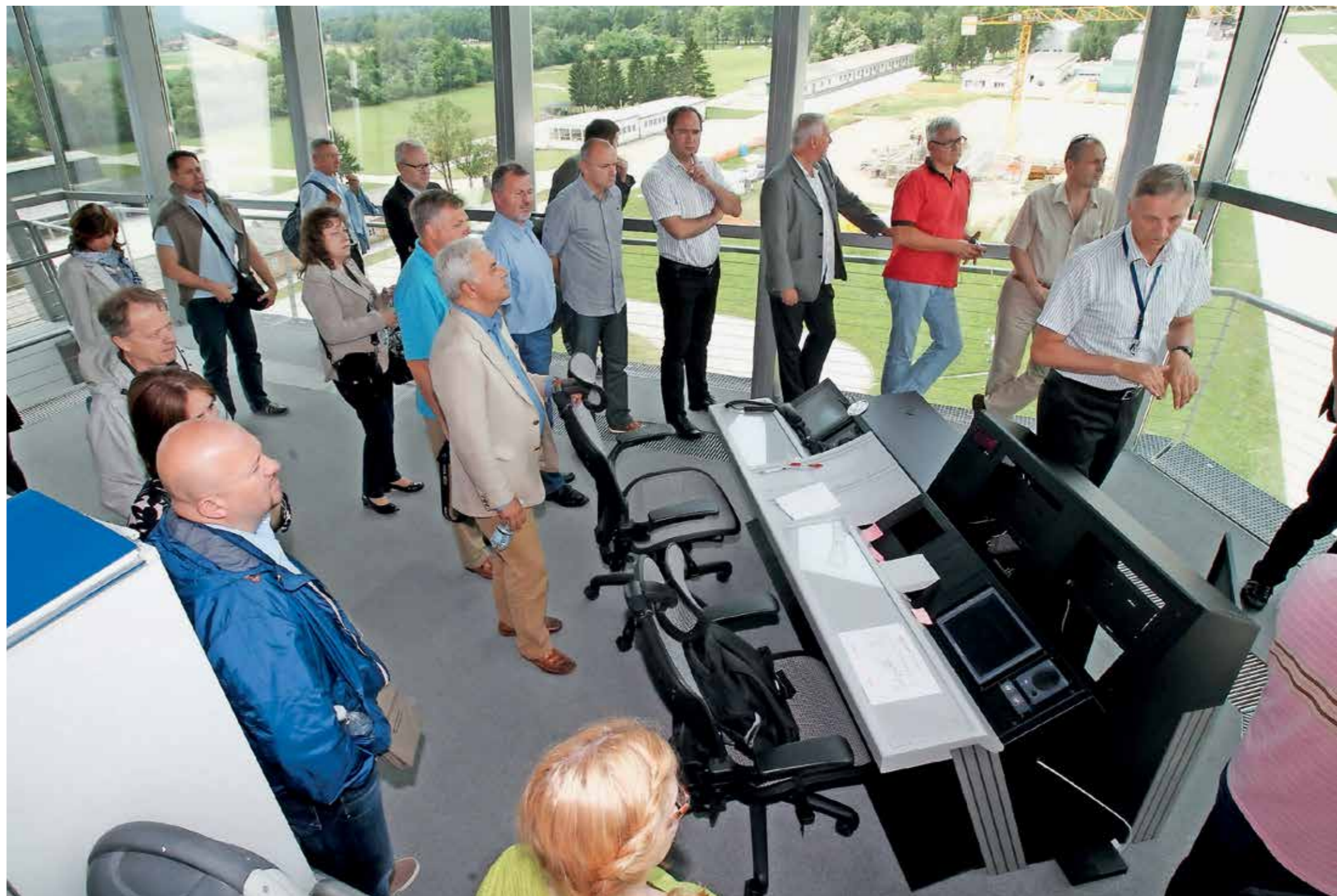
ČLANI NATOVEGA ODBORA ZA INVESTICIJE MED OBISKOM V NOVEM KONTROLNEM STOLPU LETALIŠČA CERKLJE OB KRKI

zavezniških zmogljivosti. Iz programa NSIP se tako financirajo projekti pretežno v okviru Natovih agencij, predvsem za informatiko in komunikacije ter za zmogljivosti v operacijah in na misijah, pa tudi projekti na ozemlju članic. Vodilo pri financiranju je tako imenovano načelo primernosti financiranja, kar pomeni, da se denar iz NSIP uporablja le za projekte, ki jih uporabljajo vse članice zaveznitva, na ozemlju držav članic pa le za tiste, ki so nad nacionalnimi potrebami