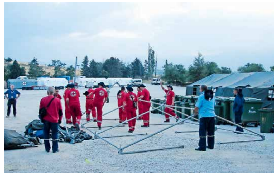
POSTAVLJANJE ŠOTOROV ZA EVAKUIRANE