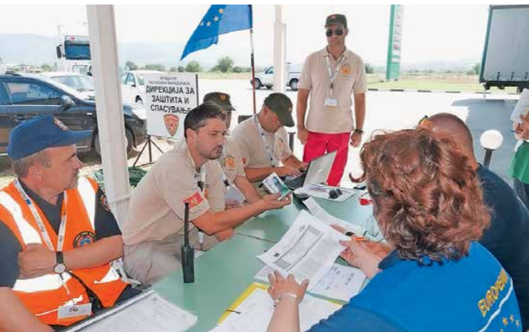
SPREJEMNI CENTER ZA MEDNARODNE ENOTE (RDC)