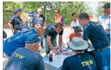
TERENSKA VAJA IPA CAMPEX 2015