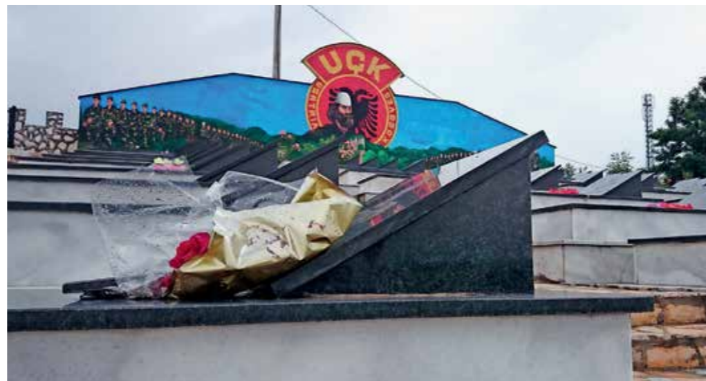
EDEN IZMED ŠTEVILNIH SPOMENIKOV PADLIM BORCEM UCK MED SPOPADOM LETA 1998 IN 1999

Slovenija v Natovi operaciji na Kosovu sodeluje že več kot 15 let oziroma od januarja 2000, do danes pa je v njej delovalo več kot 6000 pripadnikov. Povprečno število pripadnikov v omenjenem obdobju je bilo približno 300. Naše sodelovanje je vrh doseglo leta 2007 ob napotitvi motoriziranega pehotnega bataljona, saj smo naenkrat napotili več kot 600 pripadnikov. Trenutno ima Slovenija na Kosovu približno 310 pripadnikov in smo tako trenutno sedma sila po prispevku za ZDA, Nemčijo, Italijo, Avstrijo, Turčijo in Madžarsko, po prispevku na število prebivalcev pa se uvrščamo v vrh. Velikokrat se pozablja, da v Kfor poleg ZDA, Hrvaške in Švice redno pošiljamo tudi helikopter, kar se šteje za približno 100 pripadnikov. Slovenija sicer stalno popolnjuje tudi eno do dve polkovniški mesti, le enkrat pa smo popolnjevali mesto brigadnega generala, kar je v slovenskem pravnem redu primerljivo z brigadirjem. To se je zgodilo šele od septembra 2012 do septembra 2013, ko smo