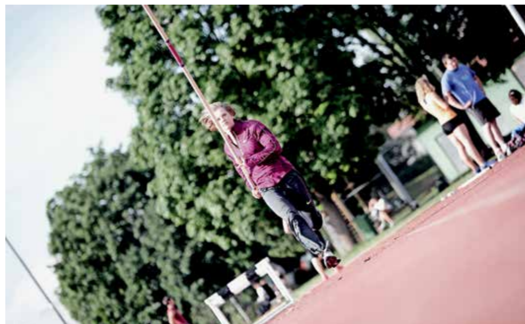
ENA, DVE, TRI, GREMO ...