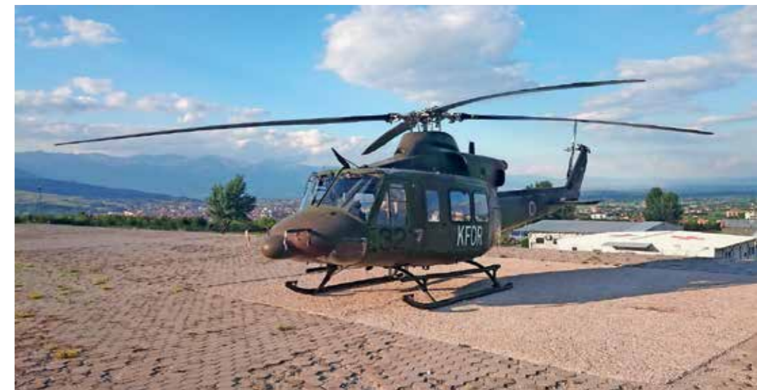
HELIKOPTER SLOVENSKE VOJSKE V BAZI VILLAGGIO ITALIA V PEČI, KJER JE NASTANJENA VEČINA PRIPADNIKOV SLOVENSKEGA KONTINGENTA

Če je napotitev civilistov v mednarodne operacije na Ministrstvu za obrambo do neke mere še sistemsko urejena prek mehanizma civilnih funkcionalnih strokovnjakov 4 , pa glede napotitev civilnih oseb na misije mednarodnih organizacij, in sicer OVSE, OZN ter EU, ni nikakršnega sistemskega mehanizma. Veliko primerljivih držav, na primer Češka, ima za izvajanje in usklajevanje omenjenih napotitev posebni organ na ministrstvu za zunanje zadeve. Slovenija slovenskih predstavnikov v omenjene organizacije ne pošilja, čeprav je na voljo veliko ustreznih mest. Omenjene organizacije posameznikom, ki jih na misije pošilja država članica, na dan večinoma dodeljujejo od 80 do 120 evrov dodatka (per diem). Omenjeni način napotitev Sloveniji ne bi predstavljal velikih stroškov oziroma bi bili zanemarljivi v primerjavi z informacijami, ki bi jih naša država od omenjenih posameznikov lahko pridobivala,