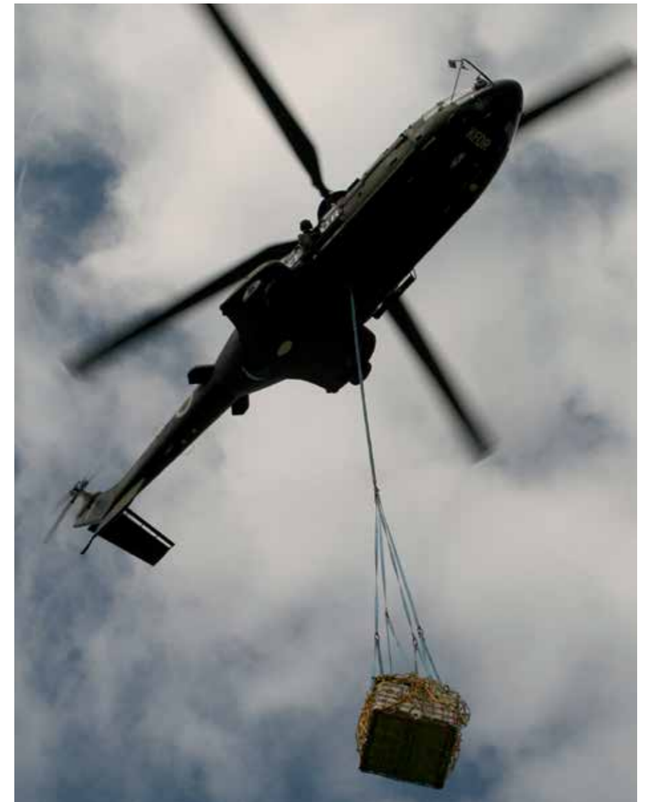
TEHNIK LETALEC NADZIRA PODVESNI TOVOR, KI JE VPET V ŠTIRIH TOČKAH.

Besedilo in fotografija: Borut Podgoršek