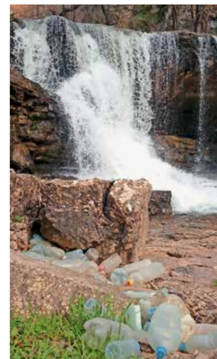
SLAPOVI MIRUŠA V OSREDNJEM DELU KOSOVA Z NASPROTIJEM MED NARAVO IN ČLOVEKOM